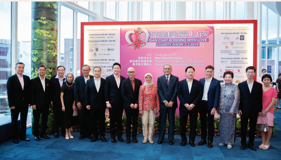
善济医社赞助人哈莉玛总统担任《善济全民爱心夜》电视筹款晚会主宾，总统夫婿穆罕默德陪同出席。

2019年7月7日 ，善济医社首次举办电视筹款《善济全民爱心夜》筹得736万的善款。现场共有300多人共襄善举，现场直播加重播的收视人次高达122万。善济医社赞助人哈莉玛总统担任活动主宾，总统夫婿穆罕默德先生、