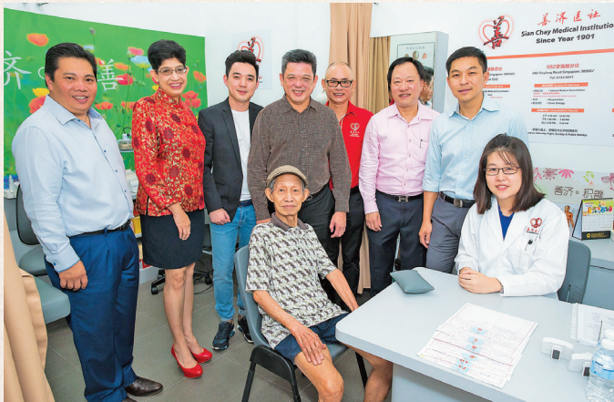
善济692芽笼分社于2016年2月26日由社会及家庭发展部长陈川仁先生主持开幕仪式，马林百列集选区国会议员花蒂玛副教授陪同出席。

2016 年 3 月 19 日 ，晚 6 点 30 分在新加坡博览中心 MAX PAVILION 举行“善济爱心慈善晚会 2016”，晚宴主宾为陈庆炎总统。受邀出席的嘉宾还有教育部代部长（高等教育及技能）兼国防部高级政务部长王乙康先生、教育部代部长（学校）兼交通部高级政务部长黄志明伉俪、总理公署高级政务部长王志豪先生、贸工部兼国家发展部政务部长许宝琨伉俪、卫生部政务部长蓝彬明伉俪、马林百列集选区国会议员花蒂玛副教授、义顺集选区国会议员郭献川伉俪。晚会筹