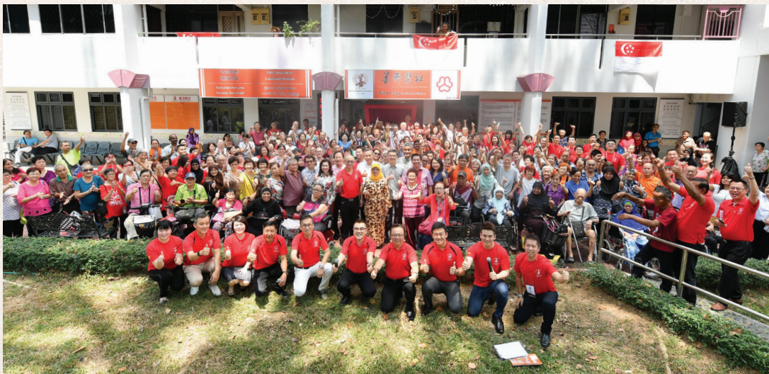
善济马西岭分社由主宾国会议长、马西岭-油池集选区国会议员、善济医社赞助人哈莉玛博士（现任总统）主持开幕典礼。

2017年8月5日 ，国会议长、马西岭-油池集选区国会议员、善济医社赞助人哈莉玛博士主持开幕仪式。哈莉玛博士在开幕仪式上赞赏善济的慈善中医诊疗理念，为人民尤其是低收入家庭，提供慈善中医门诊服务，而且目前非华族看诊者占总看诊人数的 40%。她在选区沿户访问居民时，都会带着善济传单，鼓励居民到该分社接受中医诊疗。