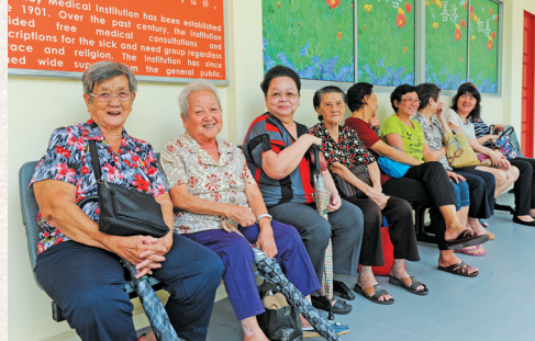
看诊人士在善济医社门外排队等候看诊。

2012年8月12日 ，后港分社由我国总理李显龙先生主持开幕仪式。李总理给予善济医社崇高的评语，赞扬百年善济走出原地，到更广泛的区域继续服务大众，服务社会。