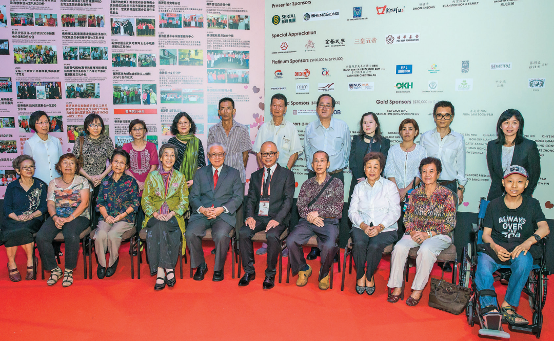
2016年3月19日于新加坡博览中心举行的善济爱心慈善晚会由陈庆炎总统担任主宾，与善济医社受惠人士合影。