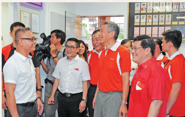
善济宏茂桥-后港分社于2012年8月12日由李显龙总理主持开幕仪式。

方面，坚持秉着五大文化价值观：“ 宽容、大爱、慈悲、感恩和祝福 ”，配合国家建设，创造和谐社会，善济医社积极推动“ 有国才有家，家和万事兴 ”；“ 善与国同在，济与民同心 ”的宏观信念。鼎力支持福利事业，积极参加各社区、团体、联络所等的慈善活动，回馈社会。